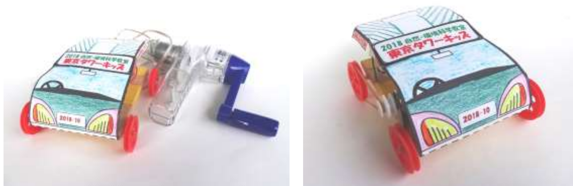
手回し発電機と充電式ミニカー