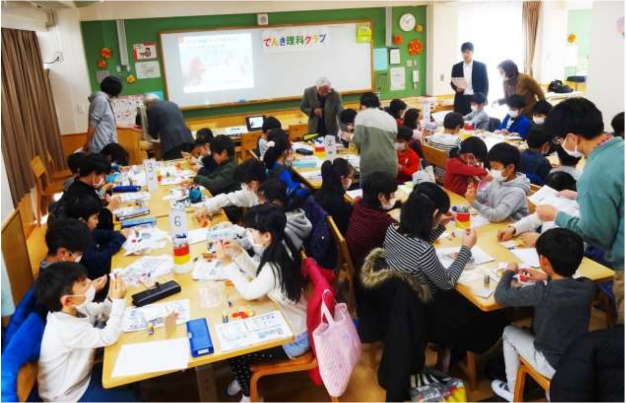
充電式ミニカーの工作風景